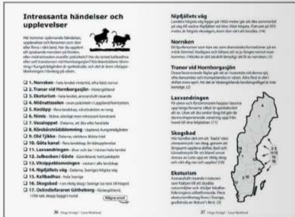
Ett av alla uppslag i boken är "intressanta händelser och upplevelser" där läsaren kan välja mellan några urval av olika aktiviteter i landet.